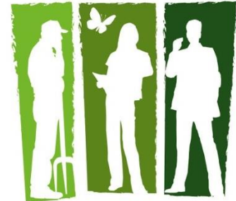
LANDWIRTSCHAFT NATURSCHUTZ POLITIK